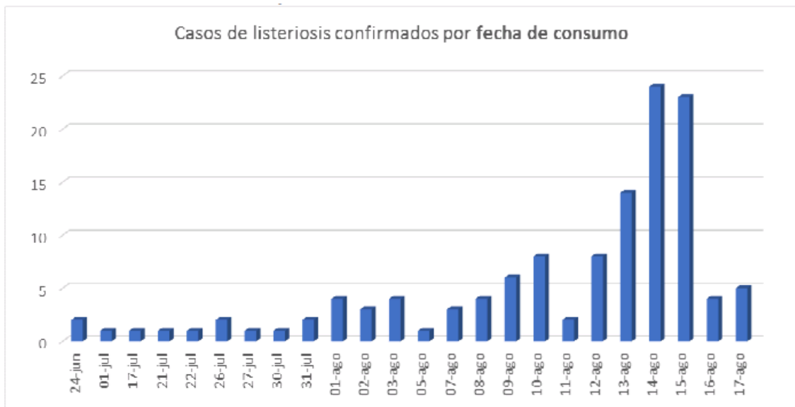
Figura 2. Distribución de casos confirmados por fecha de consumo (conocida)