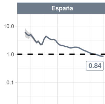
Figura 3: Número medio de casos secundarios generados por cada caso primario ( R_0 )